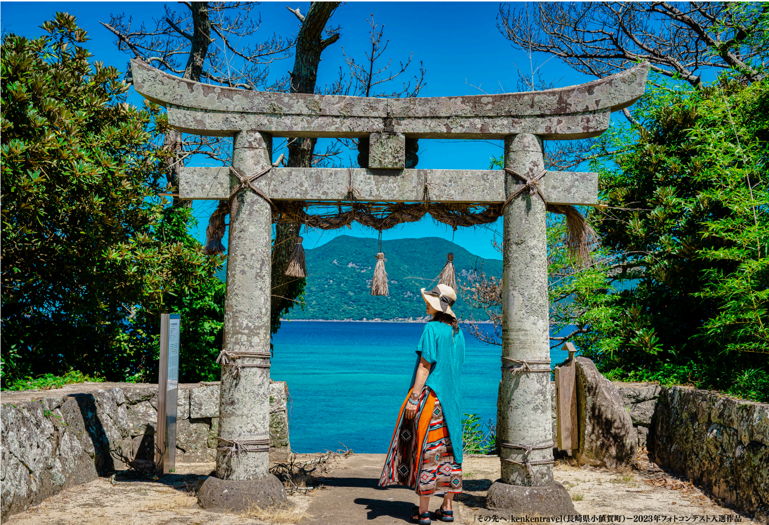
[その先へ]kenkentravel(長崎県小値賀町)ー2023年フォトコンテスト入選作品

失ったら二度と取り戻せない日本の農山漁村の景観と文化。日本の原風景。 あなたの写真・動画の力で、後世に残しませんか。